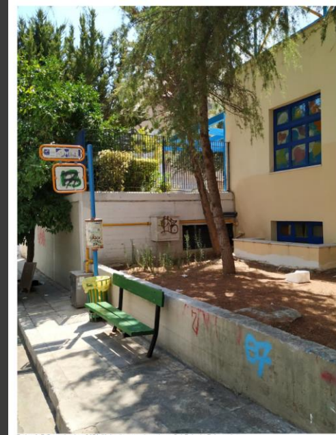
Εικόνα 3: Ενδεικτική στάση ΟΑΣΑ (Κρήνη) με παγκάκι επί της οδού Παλιών Πολιτισμών.