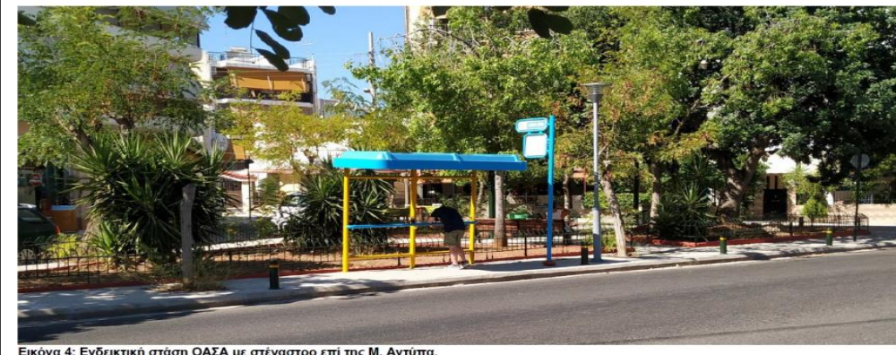
Εικόνα 4: Ενδεικτική στάση ΟΑΣΑ με στέγαστρο επί της Μ. Αντύπα.